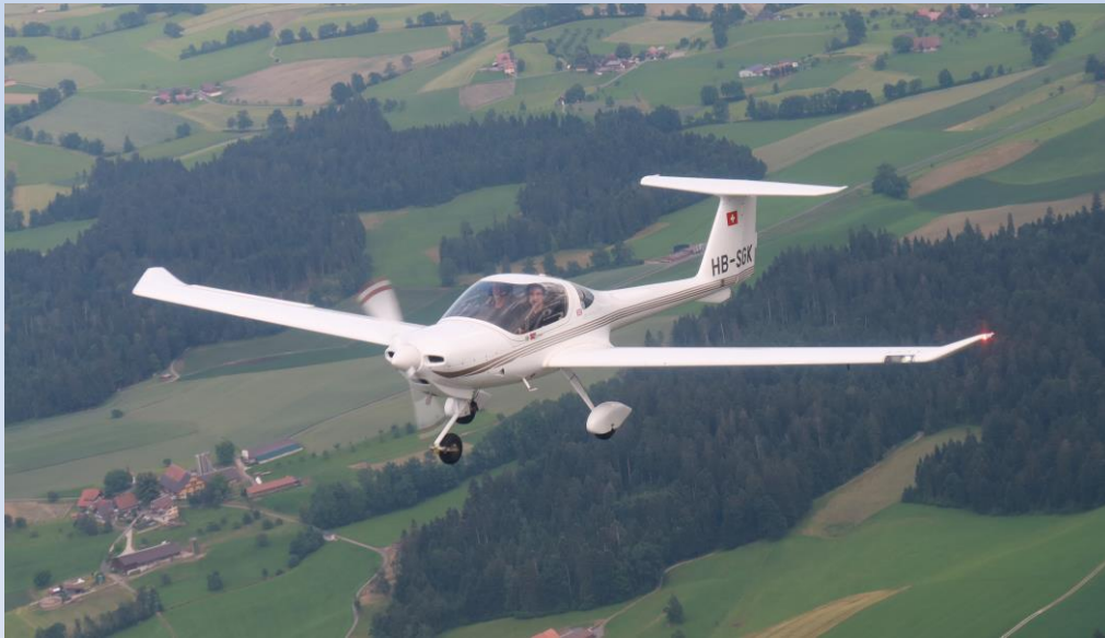
HB-SGK / Diamond DA-20