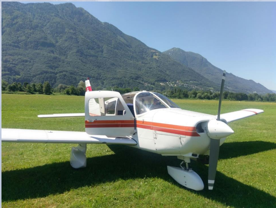
HB-PNG / Piper PA-28-161